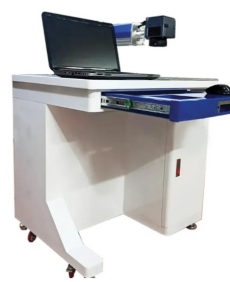
دستگاه فایبر مارکینگ میزدار مدل MF ۵۰