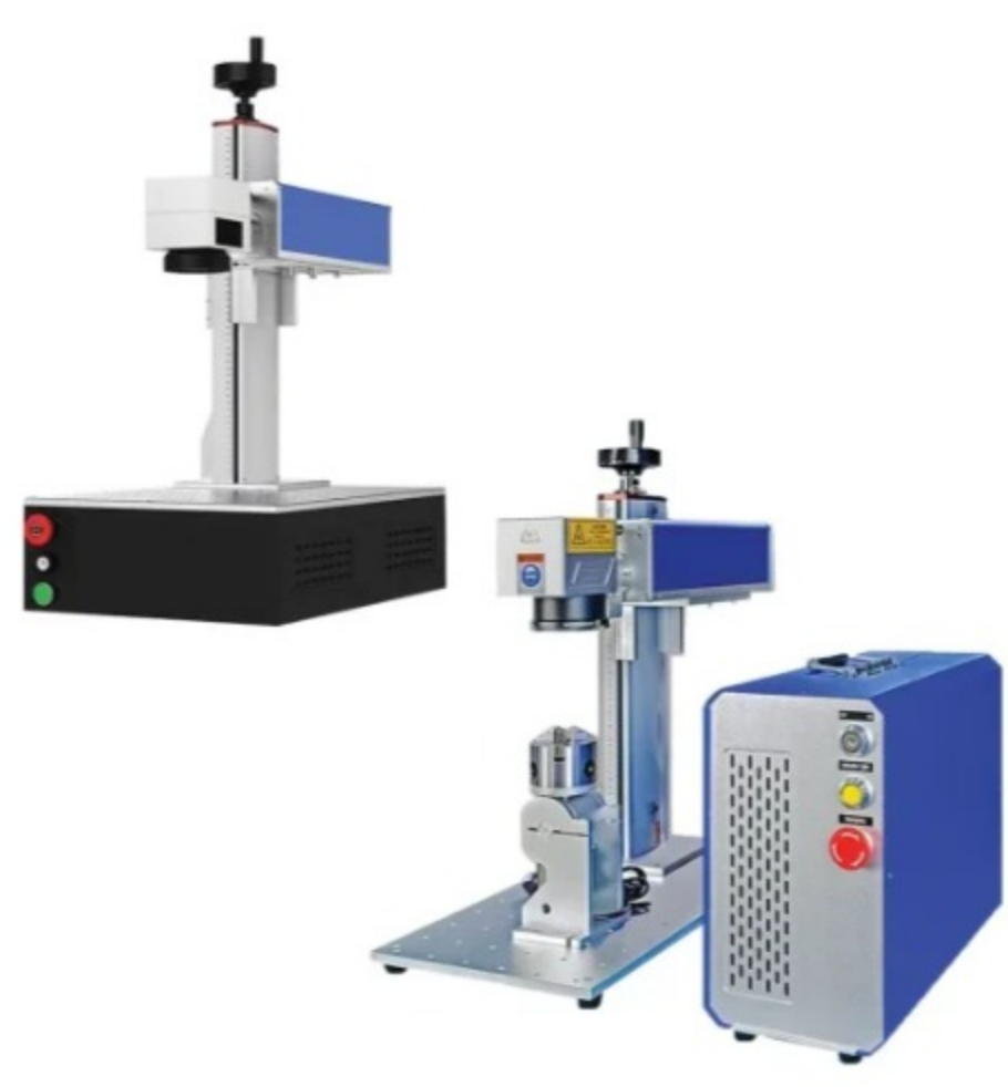
دستگاه فایبر مارکینگ مدل RF ۳۰