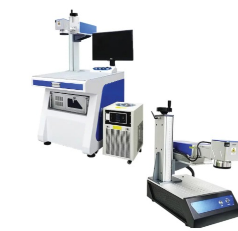
دستگاه فایبر مارکینگ UV ۰۳ RU