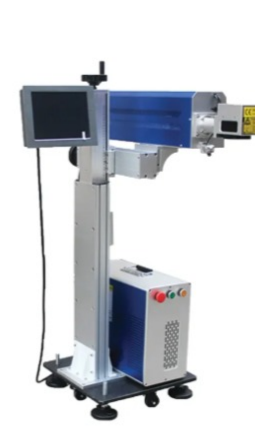
دستگاه حکاکی فلای مارکینگ (CO2-Fiber-UV)